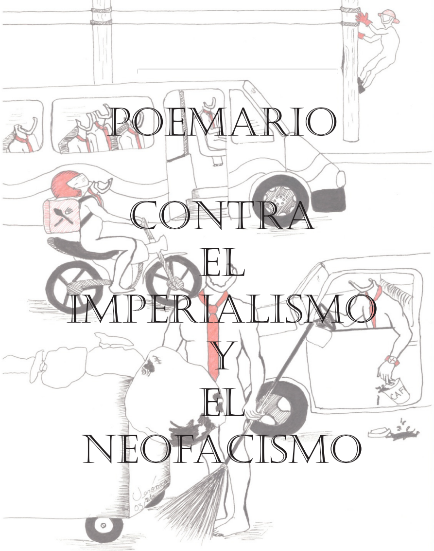
Ilustración de Verónica Sandoval Ávila

Sindicato Independiente de Trabajadores de la Universidad Autónoma Metropolitana | Abril 2026 | Edición especial